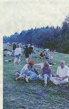
Tanta gente ovunque