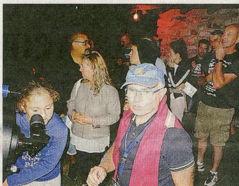
Uno spettacolo per grandi e giovanissimi